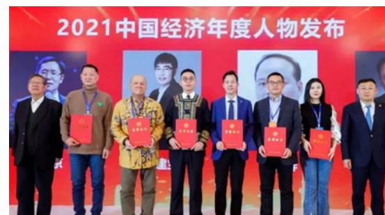
第十九届中国经济年度人物发布