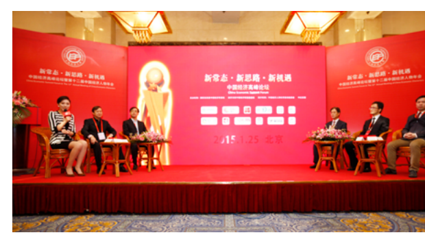
第十二届中国经济高峰论坛