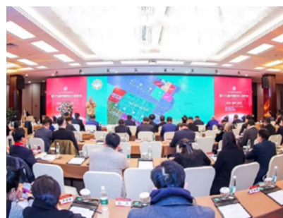
2021中国经济高峰论坛之项目发布