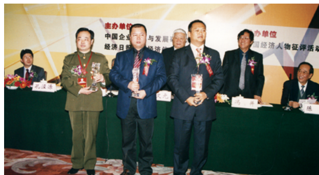
第三届活动于2006年1月14日在北京人民大会堂举行了隆重的颁奖盛典