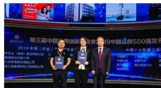
2019中国品牌500强排行榜颁奖典礼