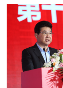
张桂平 苏宁环球集团董事长