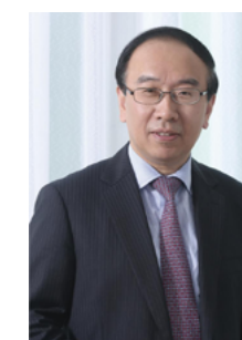
张东宁 北京银行董事长