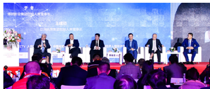
第十七届中国经济高峰论坛企业家对话