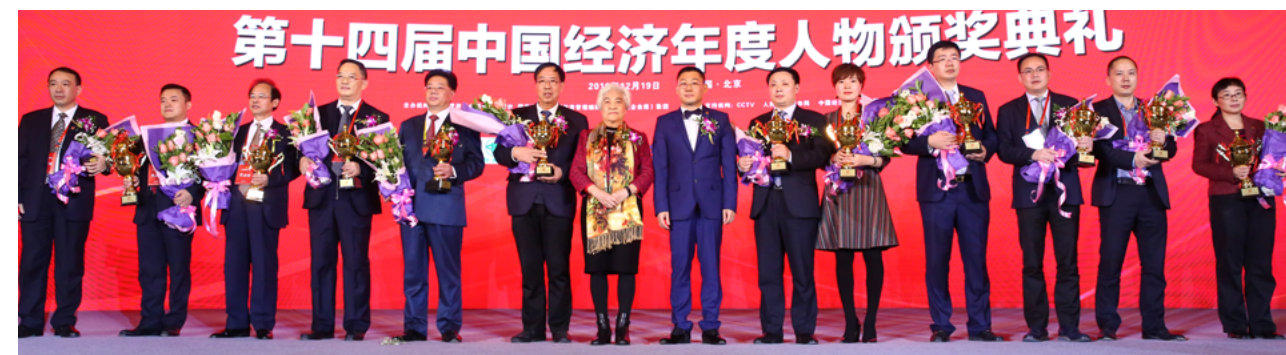
第十四届中国经济年度人物颁奖典礼