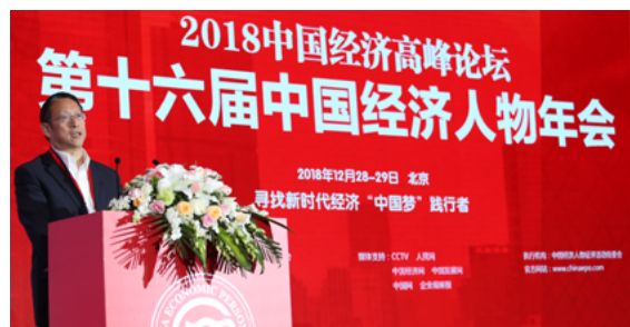
全国政协副主席、民革中央常务副主席郑建邦在2018中国经济高峰论坛致辞