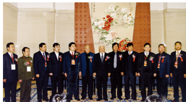
第五届活动于2007年12月27日在北京人民大会堂举行了隆重的颁奖盛典