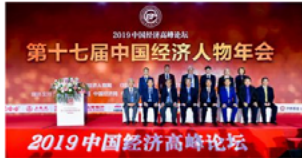
2019中国经济高峰论坛开幕合影

2019年12月15日，以“新经济、新发展、新格局”为主题，由《经济》杂志社、《环球时报》社、中国亚洲经济发展协会联合举办的“2019中国经济高峰论坛暨第十七届中国经济人物年会”在北京东方君悦大酒店举行。大会旨在挖掘中国经济进程中的领军人物和先进典型，寻找中国70年经济腾飞的创造者，更好地推进中国经济高质量发展。