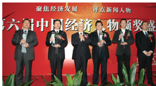
第六届活动于2008年12月27日在北京举行了隆重的颁奖盛典