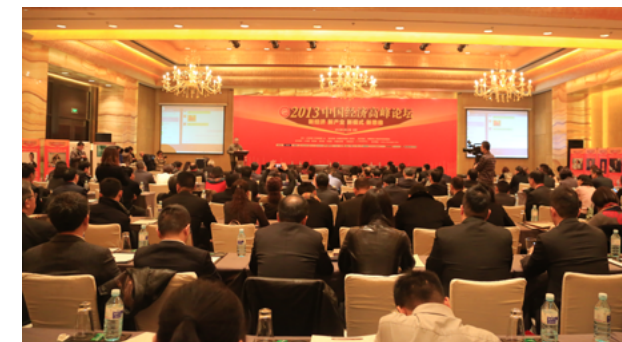
第十一届中国经济高峰论坛现场