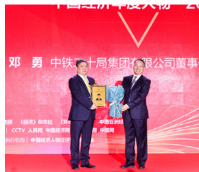
中铁二十局集团董事长邓勇出席颁奖典礼