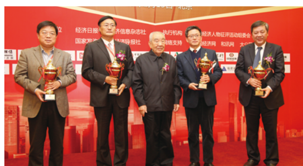
第九届中国经济年度人物颁奖典礼