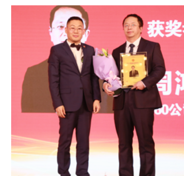
360公司董事长周鸿祎出席颁奖典礼