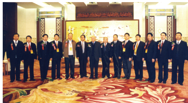
第二届活动于2004年12月26日在北京人民大会堂举行隆重的颁奖盛典