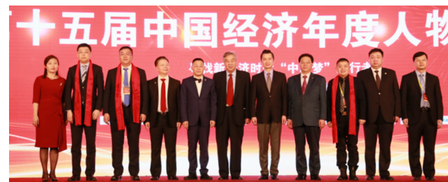
第十五届中国经济年度人物颁奖典礼