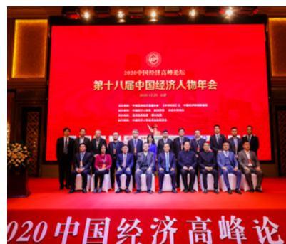
第十八届中国经济人物年会