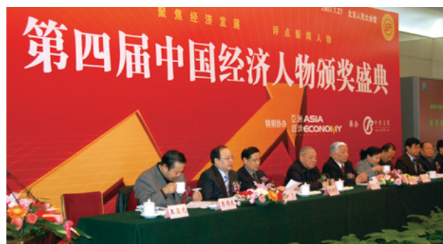
第四届活动于2007年1月27日在北京人民大会堂举行了隆重的颁奖盛典