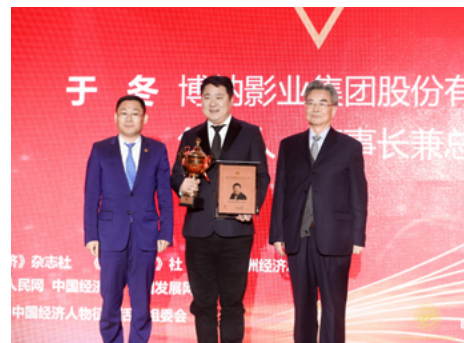
博纳影业集团董事长于冬出席颁奖典礼