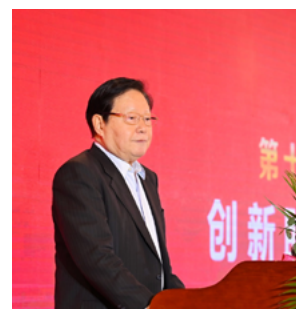
2021中国经济高峰论坛嘉宾演讲