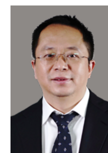
周鸿祎 360公司董事长兼CEO