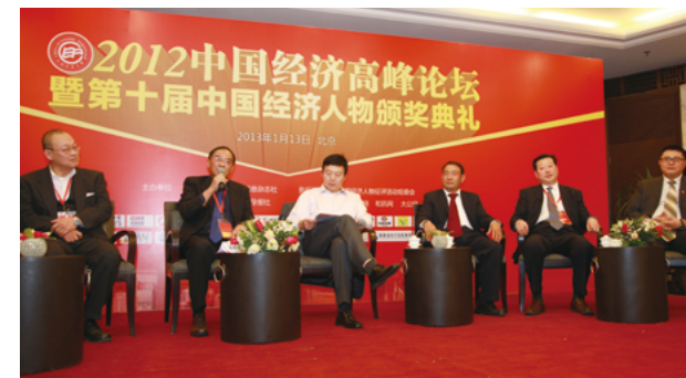
第十届活动获奖代表在2012中国经济高峰论坛上发言