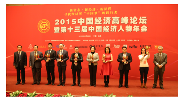
第十三届中国经济人物颁奖典礼