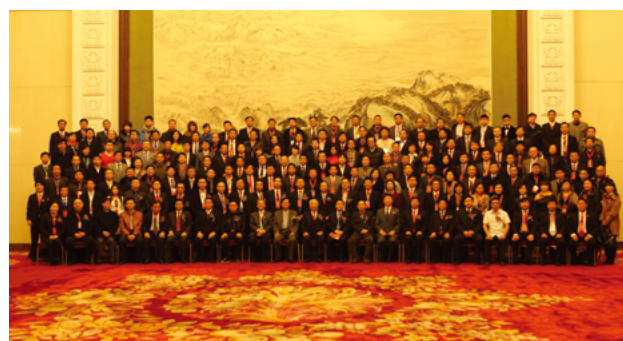
第八届活动的获奖代表在人民大会堂合影