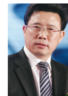
梁稳根 三一集团有限公司董事长