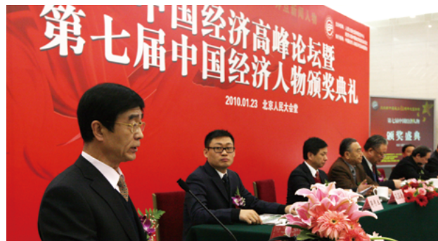
第七届活动于2010年1月23日在北京人民大会堂举行了隆重的颁奖盛典